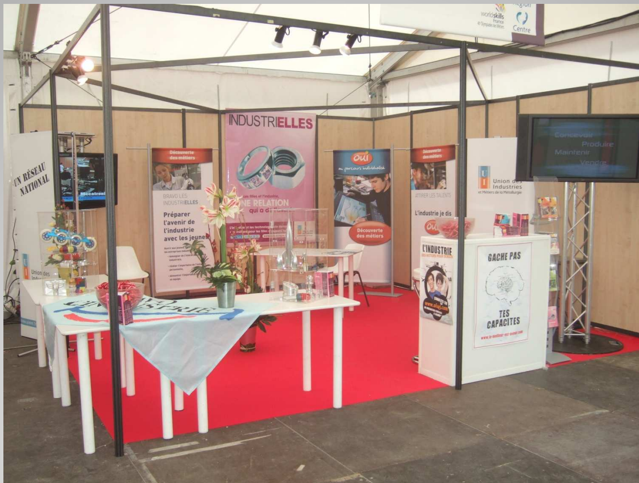
Pôle Industrie : Stand UIMM